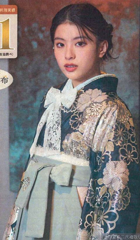
出口夏布二尺袖取り扱い店