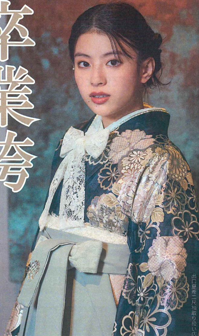
出口夏布 一尺袖取り扱いです