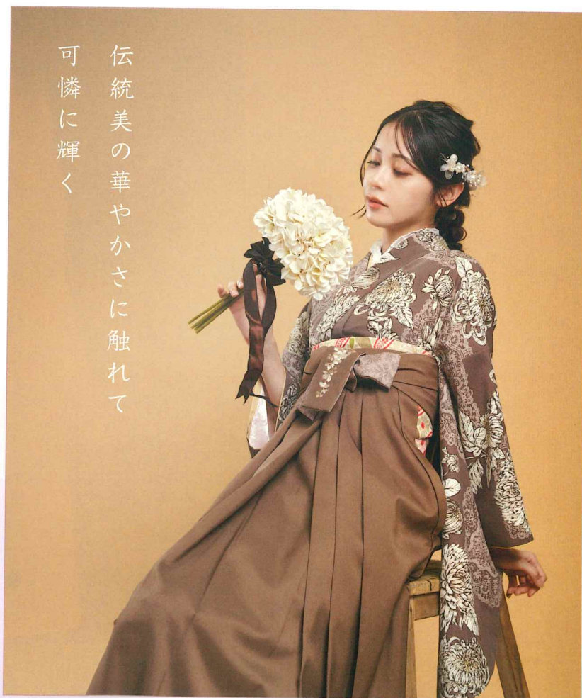
●着物 | BBB490 | 58,300円 ●袴 | CLS956 | 22,000円