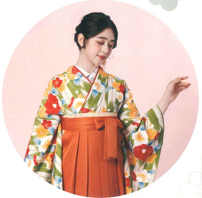
● 着物 | CCC586 | 44,000円 ● 袴 | ORG010 | 11,000円