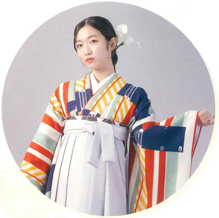
● 着物 | BBB439 | 38,500円 ● 袴 | NWG002 | 13,200円