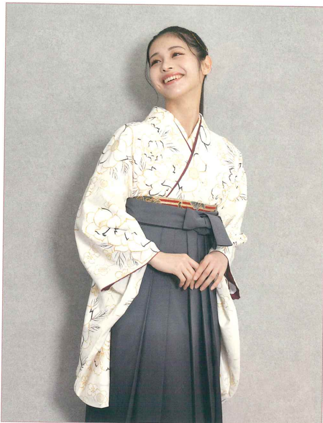
●着物 | BB4003 | 55,000円 ●袴 | GRB040 | 15,400円