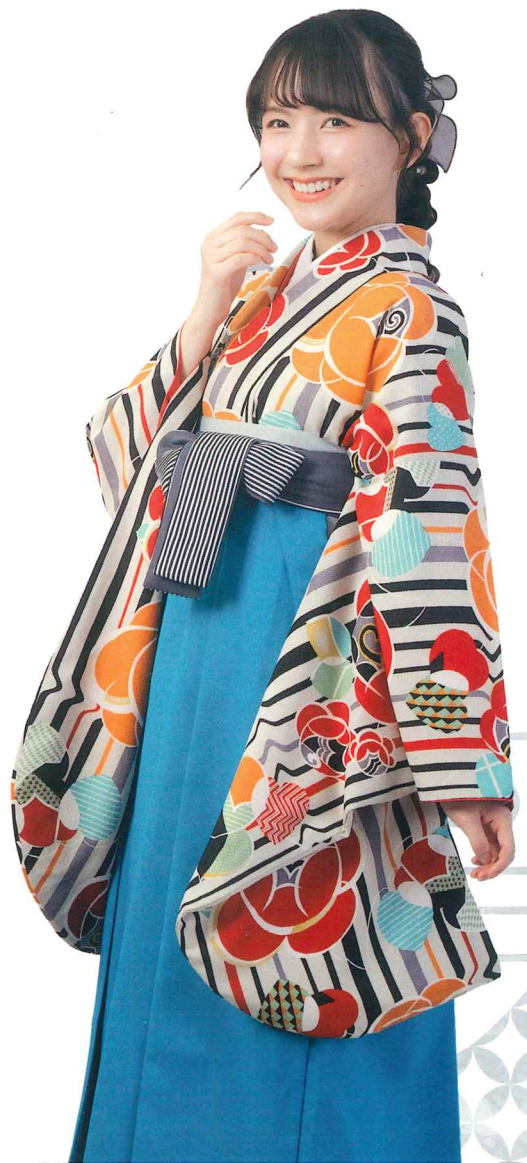
● 着物 | BBB445 | 38,500円 ● 袴 | BLS020 | 16,500円