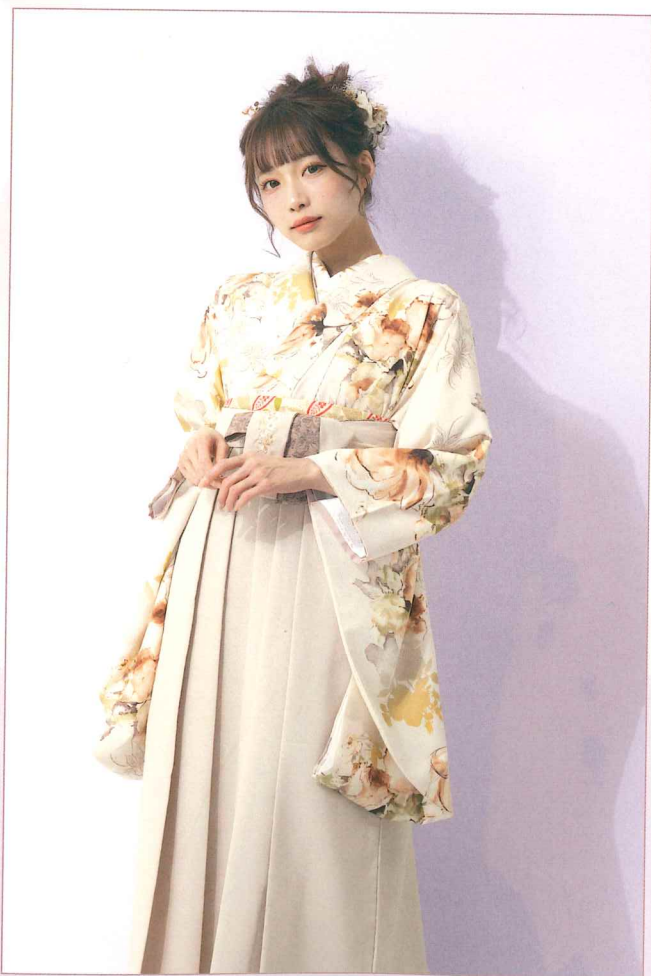
●着物 | BBB494 | 58,300円 ●袴 | MNN998 | 22,000円