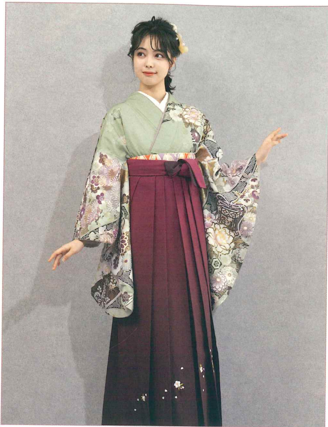
●着物 | BBB492 | 58,300円 ●袴 | WBS060 | 20,900円